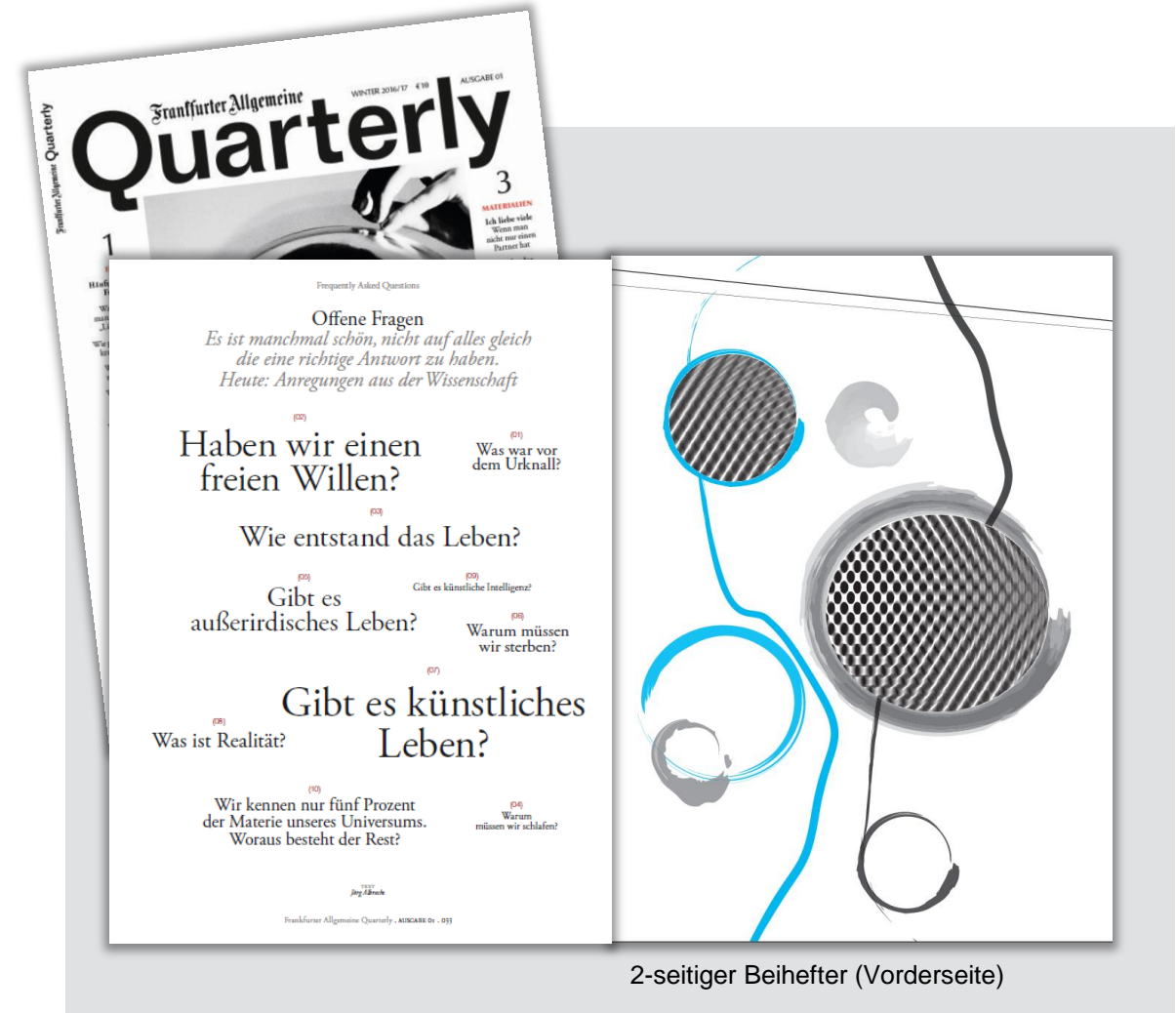
2-seitiger Beihefter (Vorderseite)

**Produktionskosten weder rabattbildend, -fähig, noch AE-fähig. Umsetzung im Format: 21cm x 29,5 cm, Ausführung: 4/4-farbig Euroskala, 170g/m2 Bilderdruck glänzend oder matt, UV-Glanzlack einseitig partiell (25-50%)