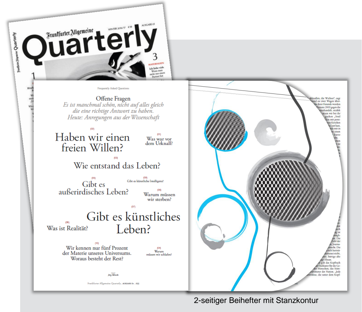
2-seitiger Beihefter mit Stanzkontur

**Produktionskosten weder rabattbildend, -fähig, noch AE-fähig. Umsetzung im Format: 21cm x 29,5 cm, Ausführung: 4/4-farbig Euroskala, 170g/m 2 Bilderdruck glänzend oder matt, UV-Glanzlack einseitig partiell (25-50%)