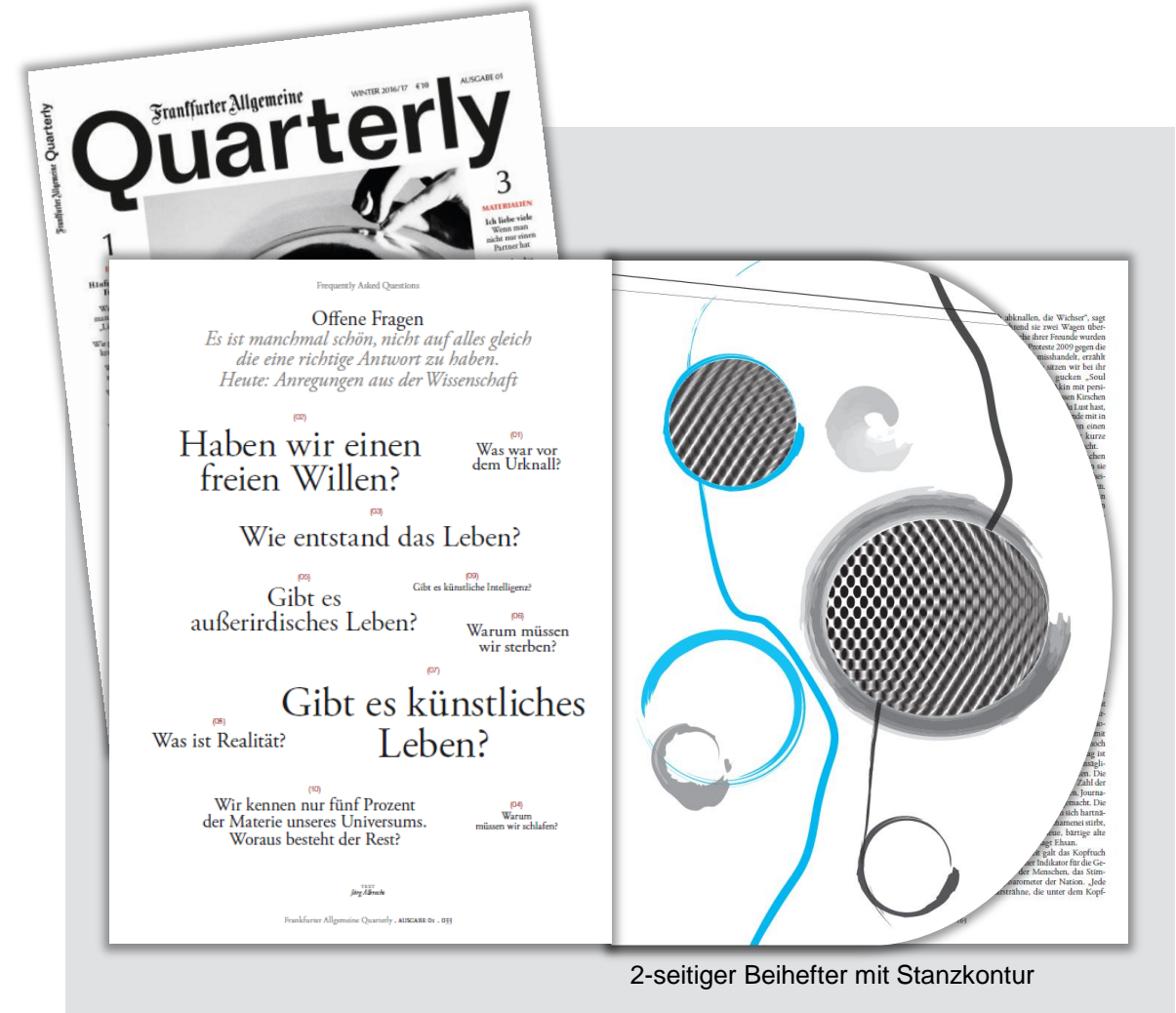
2-seitiger Beihefter mit Stanzkontur

**Produktionskosten weder rabattbildend, -fähig, noch AE-fähig. Umsetzung im Format: 21cm x 28,5 cm, Ausführung: 4/4-farbig Euroskala, 170g/m 2 Bilderdruck glänzend oder matt, UV-Glanzlack einseitig partiell (25-50%)